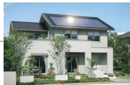
パナソニックホームズ