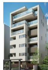
パナソニックホームズ